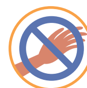
EVITE TOCAR OLHOS, NARIZ E BOCA COM AS MÃOS NÃO HIGIENIZADAS

CONTAMOS COM O CUIDADO E ATENÇÃO DE TODOS!