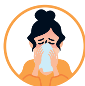
AO TOSSIR OU ESPIRRAR, CUBRA NARIZ E BOCA COM LENÇO OU O BRAÇO