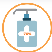
NA FALTA DELES, USE ÁLCOOL GEL 70%