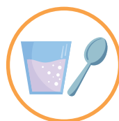
NÃO COMPARTILHE OBJETOS DE USO PESSOAL