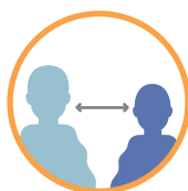
AO FALAR, MANTENHA UMA DISTÂNCIA DE 40CM DA PESSOA