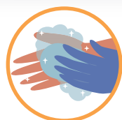
LAVE FREQUENTEMENTE AS MÃOS COM ÁGUA E SABÃO