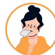
TOSSE, ESPIRRO OU SALIVA