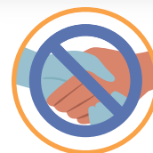
NÃO CUMPRIMENTE COM BEIJO E APERTO DE MÃO